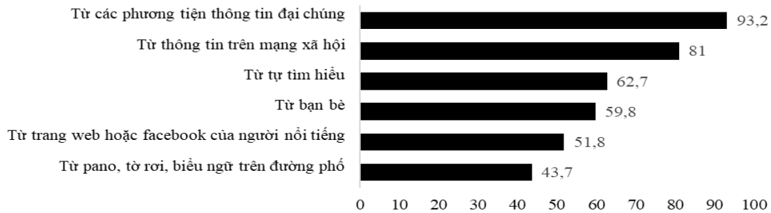
Hình 3. Tỷ lệ học sinh tiếp nhận các nguồn kiến thức về hệ sinh thái rừng trong xã hội