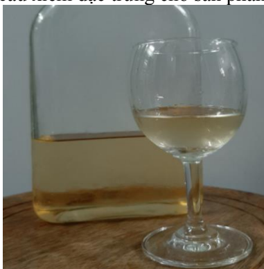
Hình 2. Sản phẩm rượu vang mĂNG cầu xiêm

Rượu vang mĂNG cầu xiêm được lên men từ mô hình tối ưu hóa các điều kiện ảnh hưởng đến quá trình lên men. Hàm lượng ethanol của rượu vang đạt 12,46% v/v. Rượu vang được đánh giá cảm quan bởi 12 thành viên dựa theo TCVN 3217:79. Về độ trong và màu sắc, rượu đạt 90% (4,5/5,0 điểm), mùi đạt 90% (4,5/5,0 điểm), vị đạt 84% (4,2/5,0 điểm). So với sản phẩm rượu vang mít lá bàng của Nguyễn Phú Hơn (độ trong và màu sắc đạt 4,4/5,0; mùi đạt 4,2/5,0 và vị ở mức 4,0/5,0) [26] thì sản phẩm rượu vang trong nghiên cứu cho kết quả đánh giá cảm quan tốt hơn về tất cả các chỉ tiêu. Nhìn chung, có thể thấy rượu vang mĂNG cầu xiêm đạt tiêu chuẩn về yêu cầu của rượu vang (TCVN 7045:2013) [27], không có mùi lạ, trong suốt, có màu vàng sáng, vị hòa hợp, giữ được mùi mĂNG cầu xiêm đặc trưng cho sản phẩm (Hình 2).