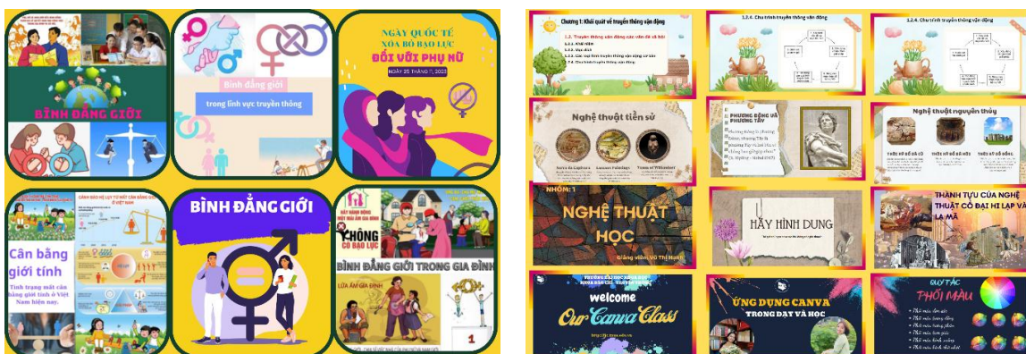
Hình 3. Một số hình ảnh về quá trình ứng dụng Canva trong hoạt động dạy và học lĩnh vực Báo chí – Truyền thông và Văn học tại Trường Đại học Khoa học

Thứ tư: Hướng sinh viên mở tài khoản Canva bằng email giáo dục (tnus.edu.vn) do nhà trường cung cấp. Với tài khoản này, sinh viên có thể khai thác toàn bộ các tiện ích Canva ưu tiên cho giáo dục mà không phải trả phí.